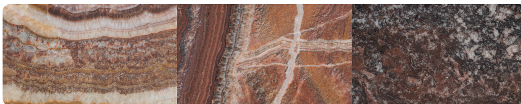
Rouille Rust O.RST