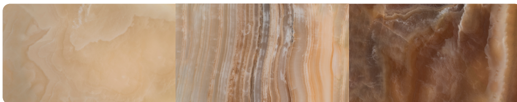
Ambre Amber O.AMB